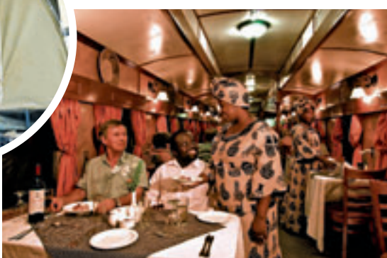
Met een truck (foto boven) reis je van Kaapstad naar Windhoek in twaalf dagen. De trein (foto onder) is comfortabeler, maar meteen ook een stuk duurder.

geleiders zorgen voor de maaltijd in de volle natuur. Na het ontbijt wordt een nieuw deel van de reis aangevat. Zo'n safaritrucktour kan het hele jaar door en kost 1.087 euro per persoon in volpension, zonder de vluchten.